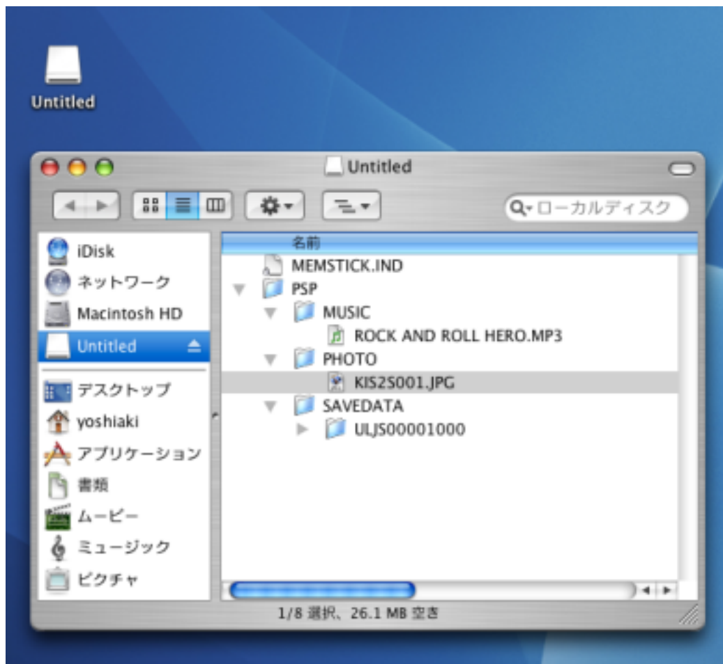
図 1) USB 接続された状態