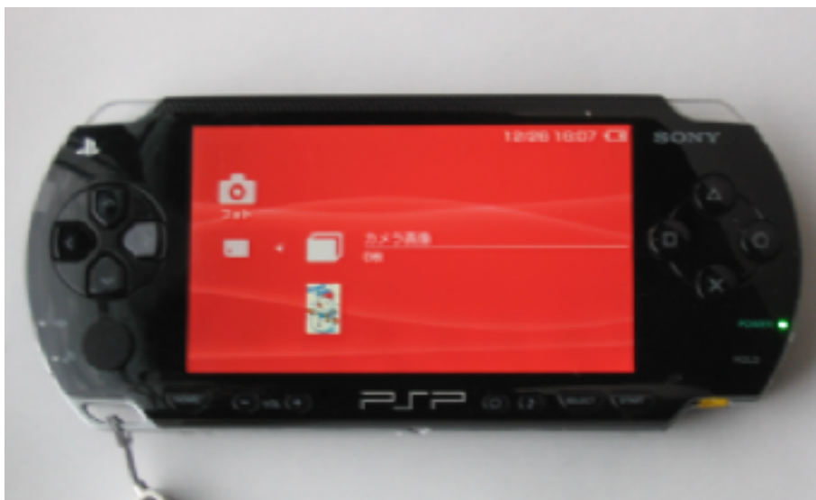
図 3) ホームメニューからフォトを選択