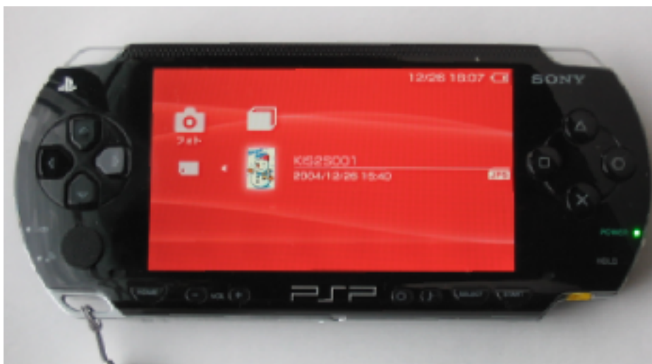
図 4) 画像を選択