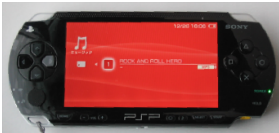
図 2) ホームメニューからミュージックを選んだ状態