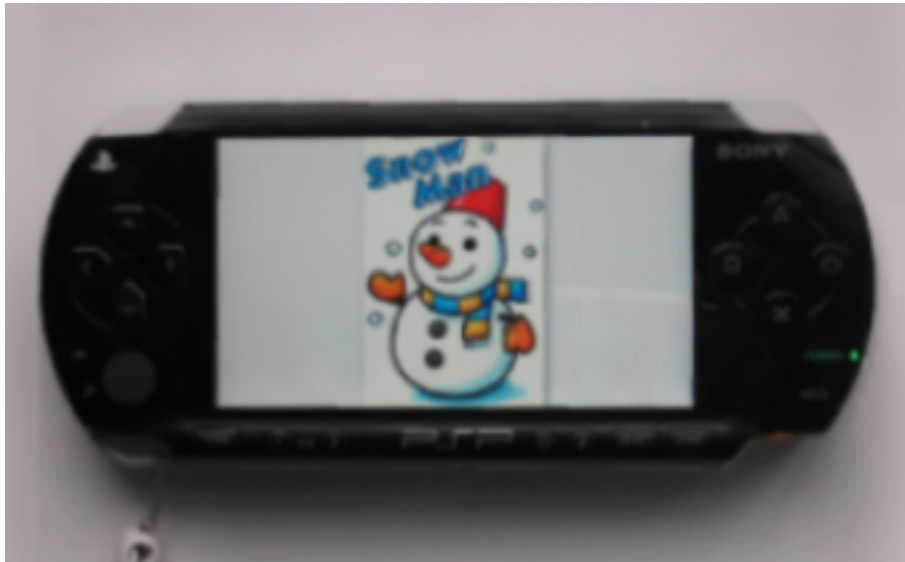
図 5) 画像を表示中