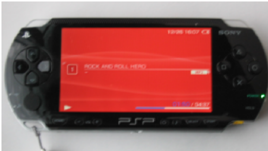
図 3) 音楽を再生中